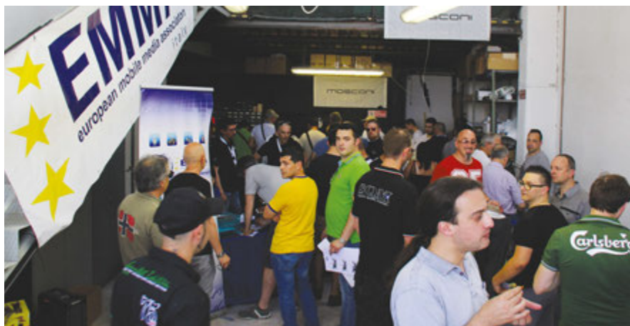
Normalmente questo spazio è la zona “installazione” di Perry Hi-Fi Car, trasformata per l'occasione in zona di incontro, segreteria delle competizioni, bar e punto di riferimento della giornata.