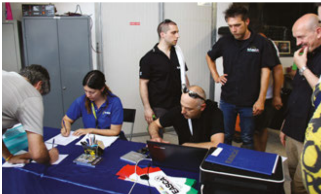
Due gare diverse, due responsabili diversi. Fianco a fianco, magari scambiandosi penne e materiali. Anche questo è PerryRaduno.