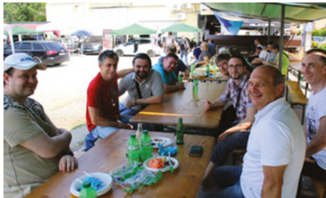
Per non parlare degli installatori. I più “pesanti” nomi del car audio italiano erano presenti in zona, alcuni con qualche auto, altri semplicemente per passare una giornata al fianco di amici e colleghi. In un clima molto disteso, naturalmente...