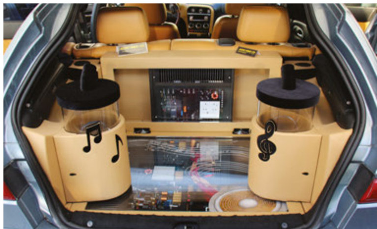
La presenza di Audio Wave non è passata inosservata neanche nelle auto. Basta guardare questa spettacolare Alfa Romeo.