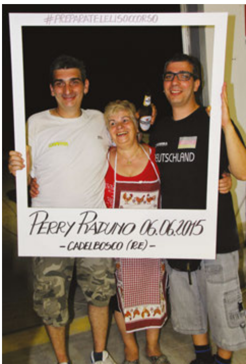
Foto ricordo: PerryFratello, PerryMamma e PerryPerry, "incorniciati" a tributo del grande successo della manifestazione...