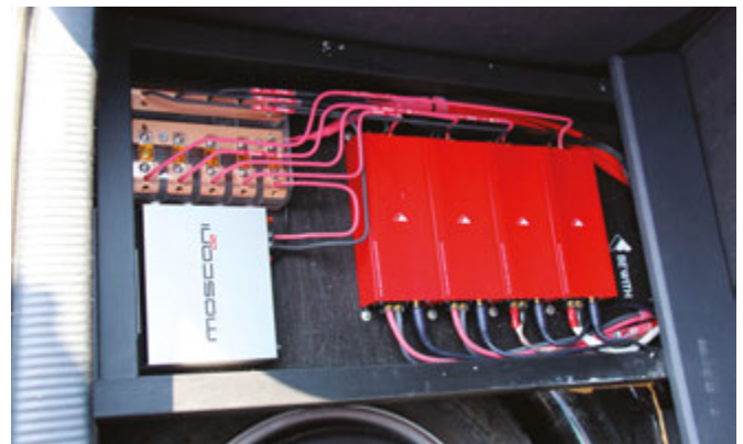
Una infilata di amplificatori Bewith che però passa in qualche modo in secondo piano a fronte della particolarità del cablaggio in aria Mikado e portafusibili realizzato da AudioMax.