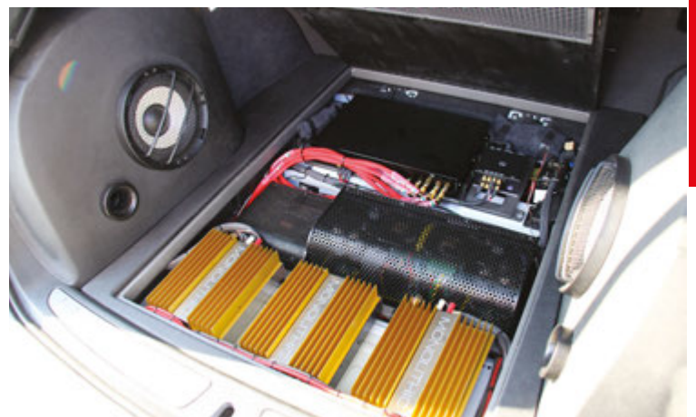
Una tripletta di Monolithic nel bagagliaio della BMW 328x realizzata a cura di Audio Future. Aspirante alla rubrica Dream Cars?