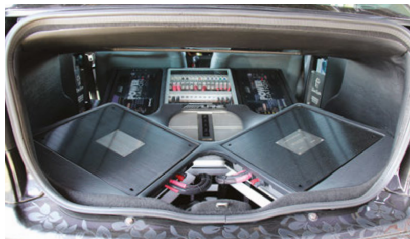
Lo scenografico bagagliaio della Mégane Coach di Music Empire: molto curata la parte di alimentazione dei due finali Brax Matrix.

no da nessun'altra parte del mondo. E sono stato coinvolto in pieno. Uno spazio davanti al centro di installazione che dava verso l'aperta campagna poteva contenere qualche decina di auto. Altre hanno trovato posto intorno all'edificio. E per questo le iscrizioni sono state limitate. Un grande spazio dedicato a tavoli e panche ed una cucina da campo