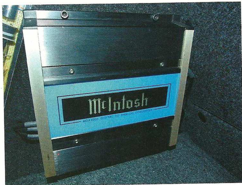
Un azzurro che una volta visto non si dimentica... È un prodotto raro e poco utilizzato, ma una volta inserito l'MDA4000 in un impianto top difficilmente si torna indietro: il fascino McIntosh continua a mietere vittime.